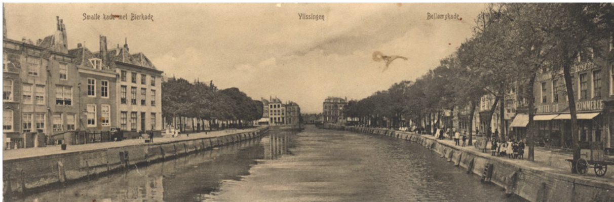
De Koopmanshaven voor de demping

zou verdwijnen. Ook de wateroverlast in de omgeving van de laaggelegen delen rond de Palingstraat zou hierdoor worden opgeheven. Ook dit plan werd in de ijskast geplaatst.