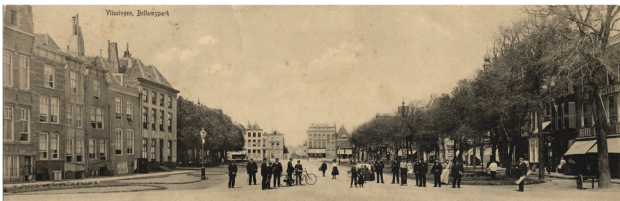
De Koopmanshaven na de demping en ingericht als Bellamypark

Na de Tweede Wereldoorlog volgde een herinrichting van het park, waardoor o.a. de fontein haar huidige plaats kreeg.